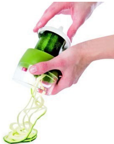
Krájení zeleniny ve směru hodinových ručiček