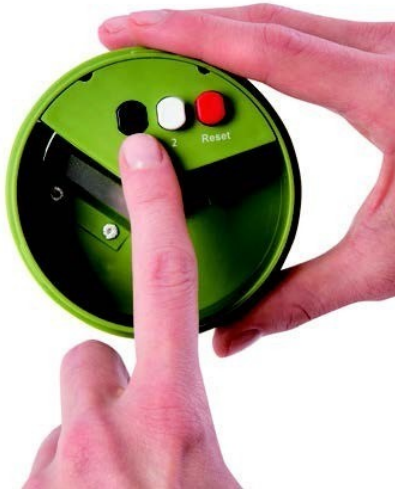
Výběr režimu pomocí tlačítek