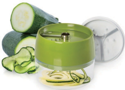
Čepel pro krájení na julienne